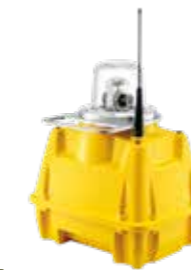
SP-401 LUCES PARA PLATAFORMAS PARA HELICÓPTEROS